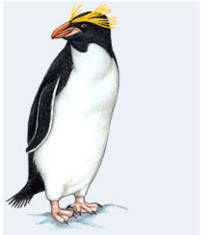
Le Gourfou Macaroni (Macaroni penguin)