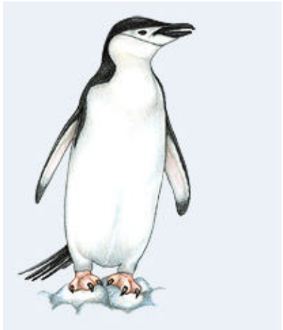
Le manchot à jugulaire (Chinstrap penguin)